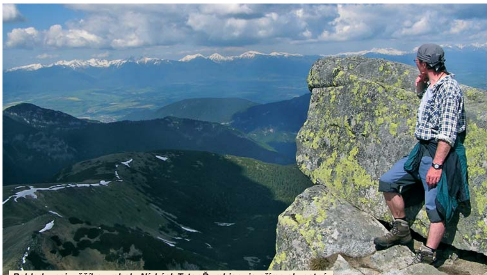
Pohled z nejvyššího vrcholu Nízkých Tater Ďumbieru je přímo skvostný.