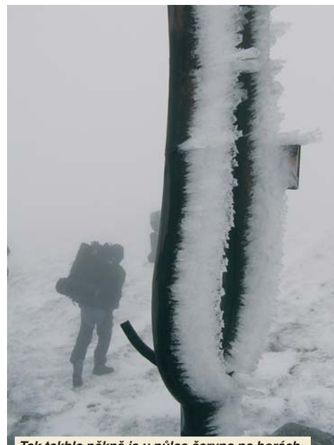
Tak takhle pěkně je v půlce června na horách.

V Popradu je citelně chladněji než u nás, ale se vším se počítalo. Ve Vysokých Tatrách prý předešle napadl skoro metr sněhu, ale proto přece jedem do Nízkých, tam by v půlce června slušně vychovaný sníh neměl co dělat. Popojíždíme do vesničky Telgárt a vydáváme se vzhůru na hřeben, směr Králova hoľa. 20kg na zádech nás hřeje až až, takže chladno nikomu nevedí. Spíše naopak. O tisíc metrů výše (samozřejmě nadmořských) už tomu je jinak. Vidět je tak na 2 metry, led létá vzduchem a zoufale se smějeme jeden druhému, jak se v poryvech vichřice roztomile potácíme. V tomhle si stan nahoře asi nepostavíme. Naštěstí na Kralovej holi už nestojí strom zelený, jak se zpívá v jedné lidové písni (a pochybuji, že kdy v téhle výšce stál), ale vysílač červený a u něj i nějaká budova. Pokoušíme