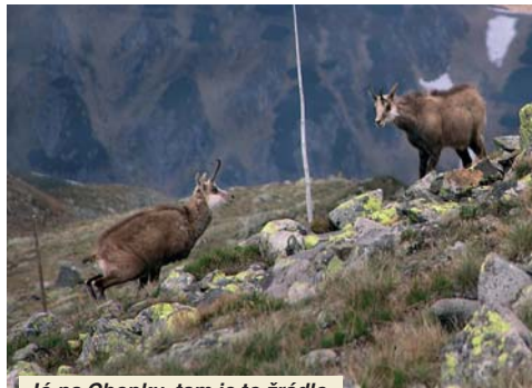
Jó na Chopku, tam je to žrádlo.

se dojit si na záchod (nepřál bych to ani největšímu nepříteli) a najít aspoň trochu závětrné místo. Při prohlížení nadějně vyhlížejícího kontejneru na odpadky, se kterým jsme chtěli trumfnout druhou pátrací skupinu, nás tato nemile překvapila objevem svým – otevřenou místností v budově, navíc s pěkně roztopeným radiátorem. ☺ Byla to volně přístupná nouzová ubytovna. (Možností nočního umrznutí, a s tím spojených zážitků, litoval jen jeden člen, říkejme mu dále extrémista.) V ní už (prý od odpoledne) jeden český pár. Ten den nikdo další nedorazil, a tak jsme ani nemuseli spát vsedě.