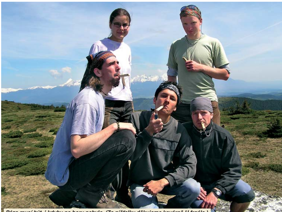
Póza musí být, i kdyby na hory nebylo. (Za pištalky děkujeme kavárně U frgála.)

Noc jsme přežili bez problémů. Ráno nás při snídani mile překvapil pár metrů od nás >>12